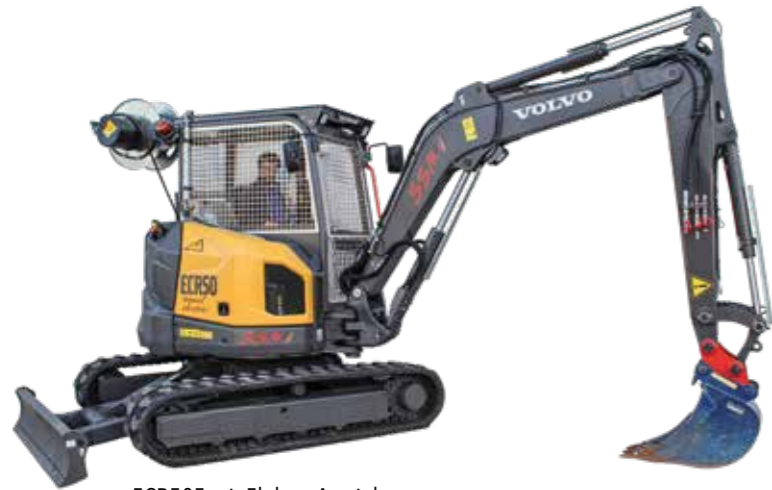
ECR50F mit Elektro-Antrieb und Funkfernsteuerung