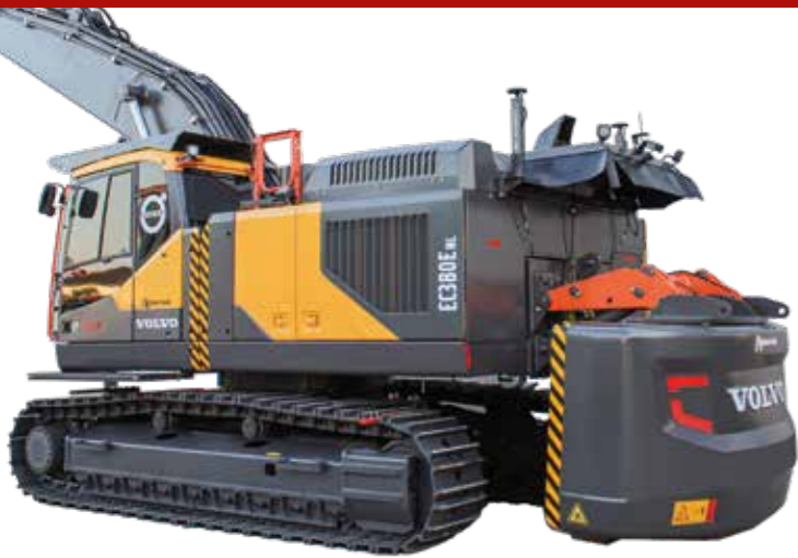
Hydraulisch absetzbares Heckgewicht