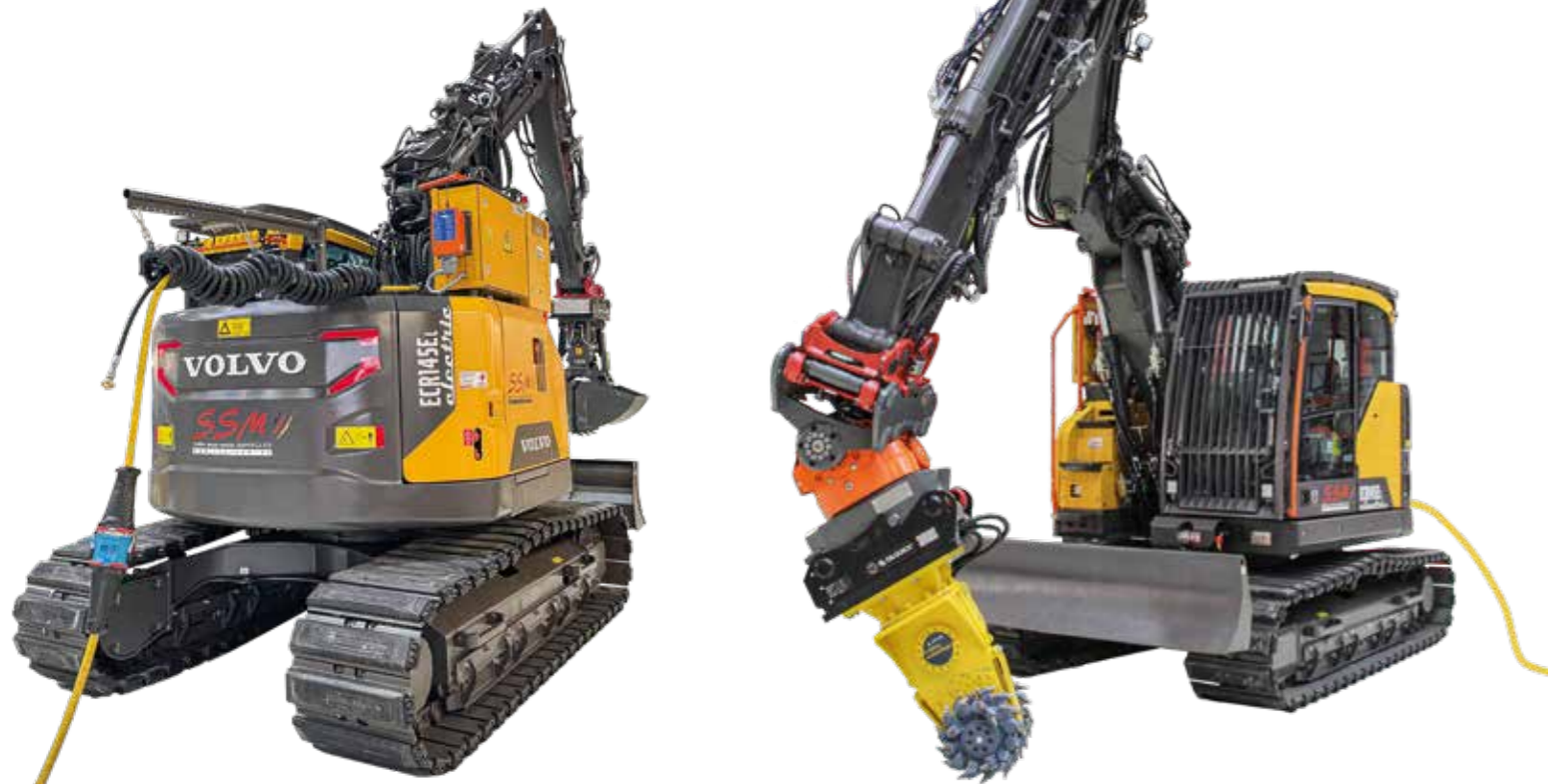
ECR145E mit Elektro-Antrieb und Funkfernsteuerung (Stromzufuhr direkt auf den Oberwagen)