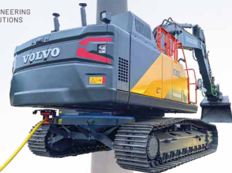
EC300E mit Dual-Drive (Kabeltrommel am Unterwagen)