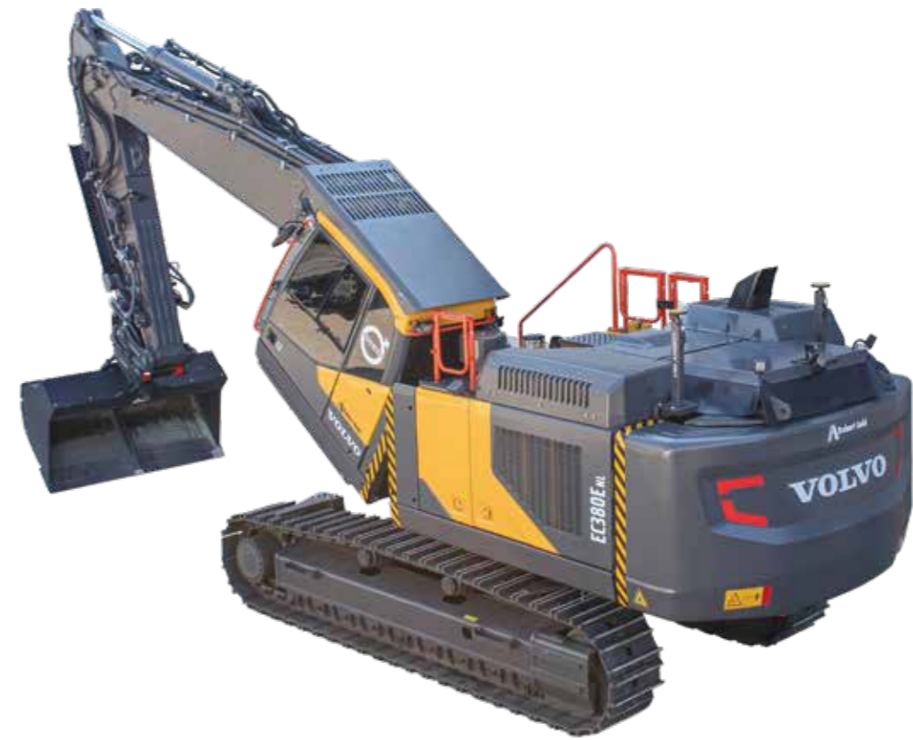
Kippbare Kabine und gestreckter Grundausleger