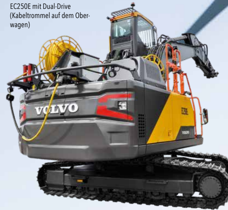
EC250E mit Dual-Drive (Kabeltrommel auf dem Oberwagen)

Um Ressourcen zu schonen und die Gesundheit der Kolleginnen und Kollegen vor Ort zu schützen, haben wir zudem Tunnelbagger und Radlader mit Elektroantrieb im Programm, die einen unterbrechungsfreien Betrieb ermöglichen.