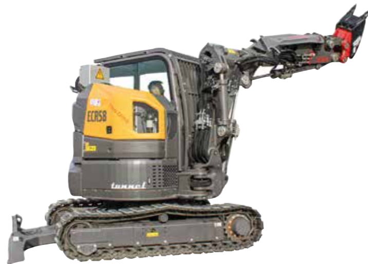
ECR58 Tunnelbagger mit TwinDrive