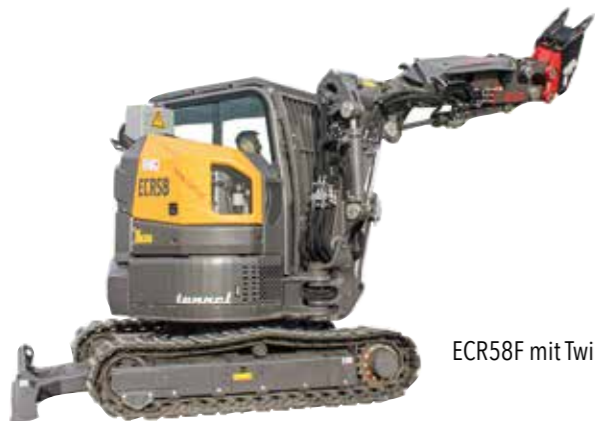
ECR58F mit TwinDrive